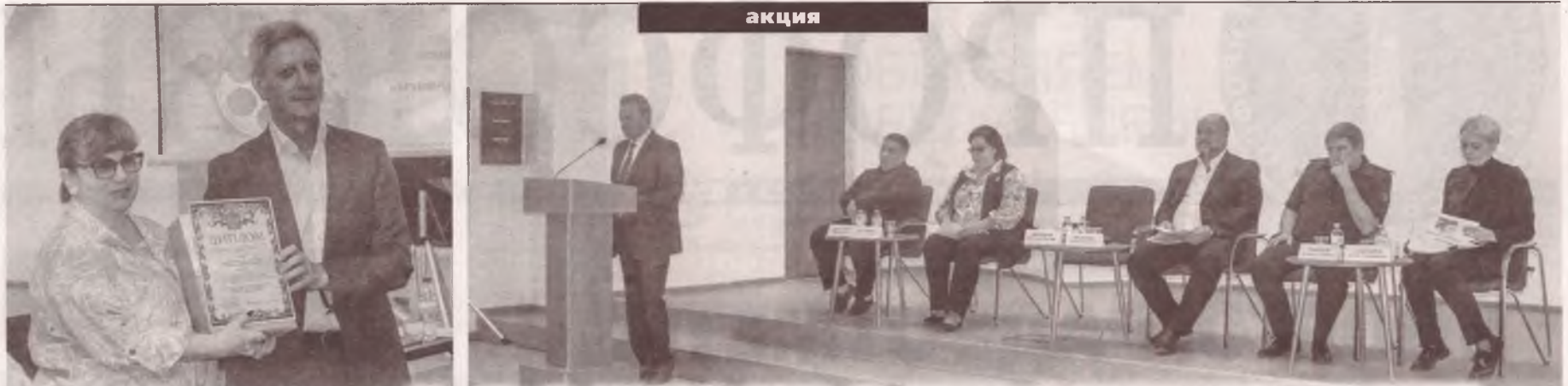
(Начало на стр. 1)